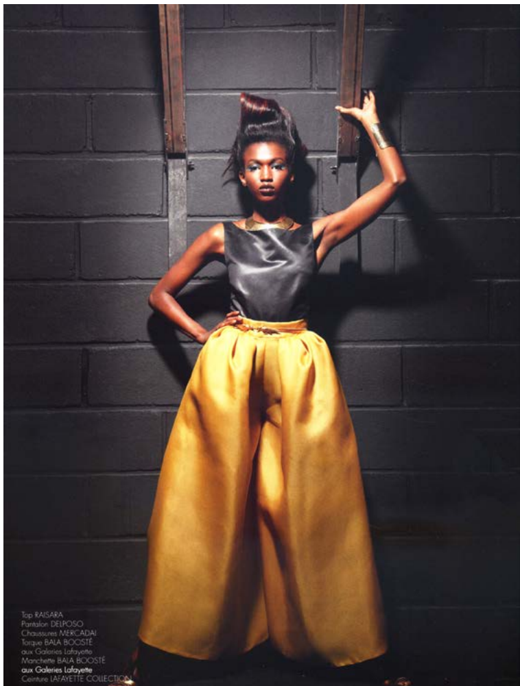
Top KASABA Pantalon DESPOSO Chaussures MERICADAI Toupe BABA BOOSTE aux Galeries Lafayette Manchette BABA BOOSTE aux Galeries Lafayette Cintre LAFAYETTE COLLECTION

Production COIFFURE DE PARIS Coloriste RODOLPHE pour Coloré par Rodolphe Coiffeur studio BRUNO WEPPE assisté de FRANCE CHARTON Styliste NIKKY Make-up CYRIL NESMON Direction artistique AGNÈS VESSIÈRE Rédaction CHARLOTTE BONNET