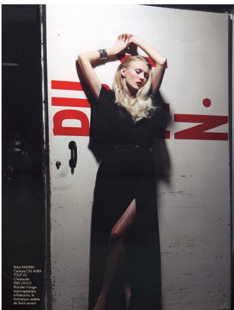
Robe RASABA Cintre ON AURA TOUT VU Chaussures FREE SANCE Bracelet Vintage suzuki japonais, à Kotocho, le magasin vedette de Saint Laurent